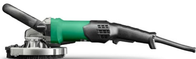
Szlifierka do betonu GM13Y