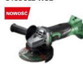
Szlifierka kątowna G18DSL2 W3Z

promocyjna brutto PLN 1030,00 katalogowa netto PLN 920,00 katalogowa brutto PLN 1131,60