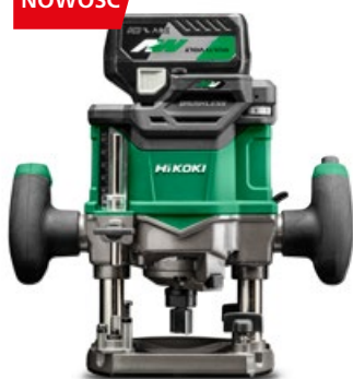
Akumulatorowa frezarka górnwrzecio- nowa 36 V M3612DA