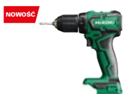
Wiertarko-wkrętarka DS18DD W4Z

promocyjna brutto PLN 1151,00 katalogowa netto PLN 1028,00 katalogowa brutto PLN 1264,44