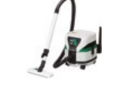
Odkurzacz RP3608DA W4Z

cena promocyjna netto PLN 2133,00 promocyjna brutto PLN 2624,00 katalogowa netto PLN 2344,00 katalogowa brutto PLN 2883,12