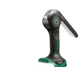
Latarka UB18DGL L0Z

promocyjna brutto PLN 778,00 katalogowa netto PLN 695,00 katalogowa brutto PLN 854,85