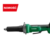
Szlifierka prosta GP18DB W5Z

promocyjna brutto PLN 326,00 katalogowa netto PLN 291,00 katalogowa brutto PLN 357,93