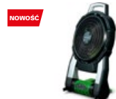
Wentylator UF18DSAL L0Z

promocyjna brutto PLN 172,00 katalogowa netto PLN 154,00 katalogowa brutto PLN 189,42