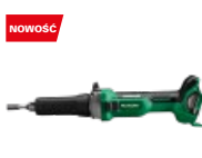
Szlifierka prosta GP18DA W5Z