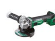
Szlifierka kątowna G18DBBVL W5Z

promocyjna brutto PLN 1033,00 katalogowa netto PLN 923,00 katalogowa brutto PLN 1135,29