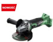
Szlifierka kątowna G18DSL2 W5Z

promocyjna brutto PLN 1119,00 katalogowa netto PLN 1000,00 katalogowa brutto PLN 1230,00