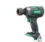
Klucz udarowy WR18DBDL2 W4Z