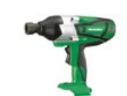
Klucz udarowy WR18DSHL W4Z

promocyjna brutto PLN 666,00 katalogowa netto PLN 595,00 katalogowa brutto PLN 731,85