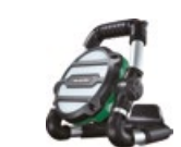
Latarka UB18DGL V0Z

promocyjna brutto PLN 941,00 katalogowa netto PLN 841,00 katalogowa brutto PLN 1034,43