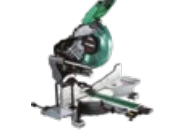
Piłarka stołowa C3610DRA W4Z

cena promocyjna netto PLN 2749,00 promocyjna brutto PLN 3381,00 katalogowa netto PLN 3021,00 katalogowa brutto PLN 3715,83