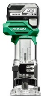
Akumulatorowa frezarka krawędziowa 18 V M1808DA