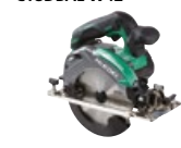
Piłarka tarczowa C18DBAL W4Z

promocyjna brutto PLN 1202,00 katalogowa netto PLN 1074,00 katalogowa brutto PLN 1321,02