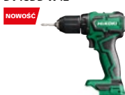
Wiertarko-wkrętarka udar. DV18DD W4Z

promocyjna brutto PLN 1173,00 katalogowa netto PLN 1048,00 katalogowa brutto PLN 1289,04