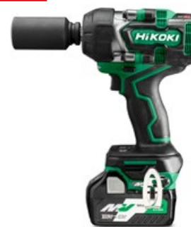
Akumulatorowy klucz udarowy 36 V WR36DE