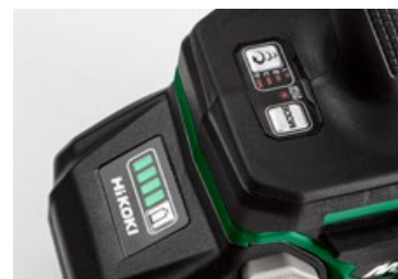
Wskaźnik poziomu naładowania akumulatora.