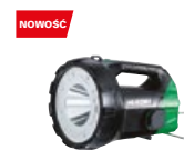
Latarka UB18DA W4Z

promocyjna brutto PLN 2091,00 katalogowa netto PLN 1868,00 katalogowa brutto PLN 2297,64