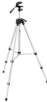
SJJ-M1 EX tripod